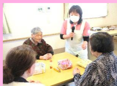
みんなで桃の花を作りました！