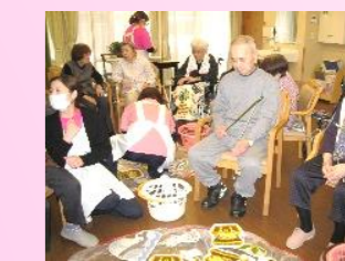
釣り竿片手に、魚釣りの始まりです！何が釣れるかドキドキですね！