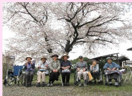
久しぶりの外出！ みんな笑顔でハイ、チーズ！