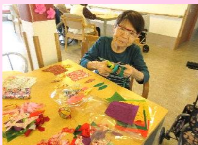
みんなで手まり作りをしました！