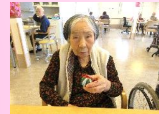
きれいな手まりが たくさんできましたね☆